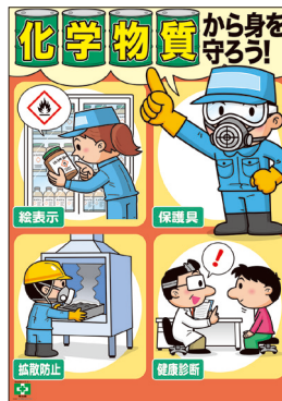
化学物質・身を守ろう No.31864