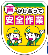
声かけ・安全作業ワッペン No.44085 定価 825円

●サイズ: H83×W50mm ●材質: ビニール ●ピン付/透明ポケット付/中紙挿入式/中紙 (H40×W15mm) 付