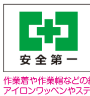
安全衛生マーク 2WAY ワッペン No.44090 定価 1,870円 5枚入

●サイズ: H37.5×W50mm ●材質: ポリエステル ※2WAY: アイロンワッペン・ステッカー両用タイプ