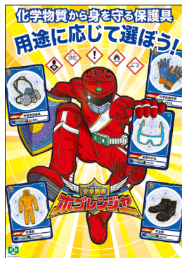
化学物質・保護具 No.31898