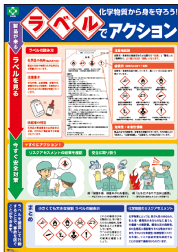
化学物質・ラベル No.31600